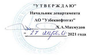
График выставления прочих нефтепродуктов через "УзРТСБ" в мае 2021 года Бухарским НПЗ