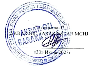
График выставления Масло хлопковое через электронные биржевые торги АО «УЗРТСБ» AKBAR OIL BARAKA STAR MCHJ Июль месяц 2023 года с разбивкой по дням