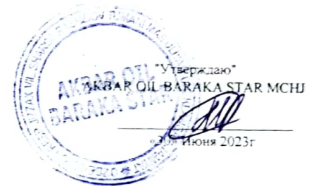
График выставления шелуха хлопковых семян через электронные биржевые торги АО «УЗРТСБ» AKBAR OIL BARAKA STAR MCHJ Июль месяц 2023 года с разбивкой по дням