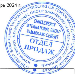
График выставления портланд цемента через электронные биржовые торги АО "УзРТБС" по ИП ООО "China Energy International Group Samarkand " за Август месяц 2024 года с разделёнными днями